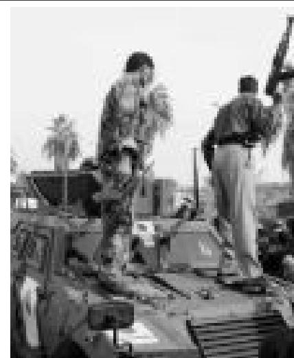
押し寄せるデモ隊を排除するため、陸自軽装甲機動車の上から自動小銃を向けるハッサン・ムサンナ州知事の護衛隊。（2005年12日5日、イラク南部サマワ郊外ルメイサ市）

...）「巻き込まれない限りは正当防衛・緊急避難の状況は作れませんから。目の前で苦しんでいる仲間がいる。普通に考えて手をさしのべるべきだという時は（警護に）行ったと思いますよ」「その代わり（その行為で）日本の法律で裁かれるのであれば喜んで裁かれてやろうと」（2007年7月）