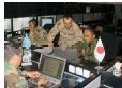
当時、バグダッドの多国籍軍司令部で、各国兵士と共に勤務する陸上自衛隊員（右）。24時間態勢で情報収集任務に就いていた。

武力攻撃が差し迫っている状況等において、住宅地内に自衛隊を引き入れることは軍事目標を住宅地につくることになり、住民の身体・生命・財産の保護について大きな懸念があります。